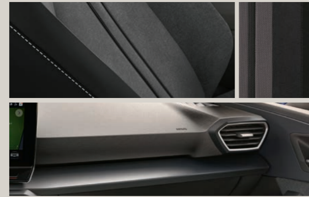
STOFF IN ANTHRAZIT