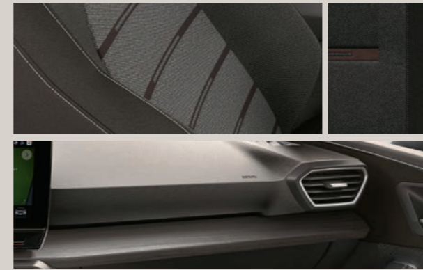
STOFF IN ANTHRAZIT