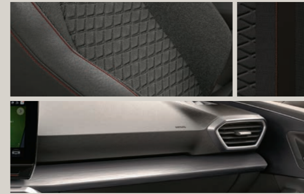
STOFF IN ANTHRAZIT