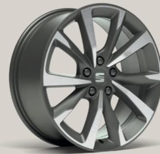
18"-LEICHTMETALLFELGE PERFORMANCE II FR