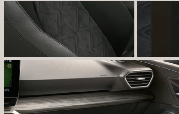
DINAMICA IN ANTHRAZIT MIT NAHTFÜHRUNG IN GRAU 1