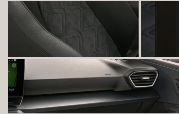
DINAMICA IN ANTHRAZIT 1