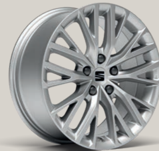
17"-LEICHTMETALLFELGE DYNAMIC I XC