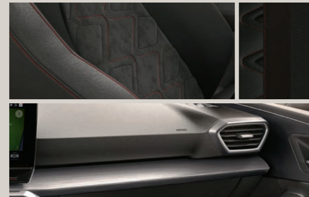
DINAMICA IN ANTHRAZIT MIT NAHTFÜHRUNG IN ROT 1