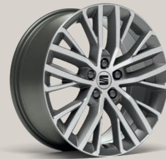
18"-LEICHTMETALLFELGE PERFORMANCE I XC