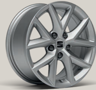
16"-LEICHTMETALLFELGE DESIGN I R St