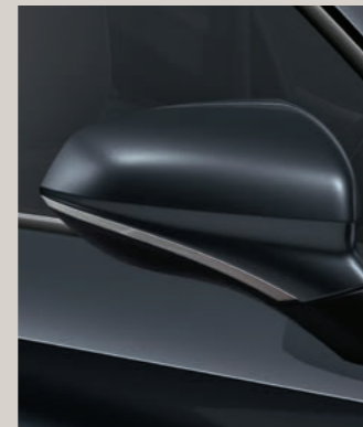
MAGNETIC GRAU (METALLIC)