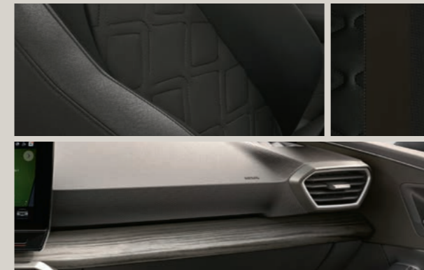
LEDER IN ANTHRAZIT MIT NAHTFÜHRUNG IN GRAU 1