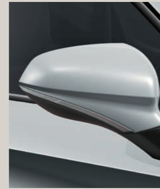
NEVADA WEISS (METALLIC)