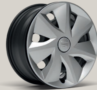
16"-RADVOLLBLENDE URBAN II R