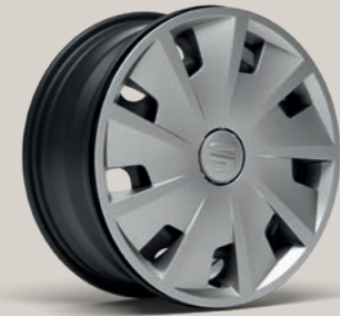
15"-RADVOLLBLENDE URBAN I R