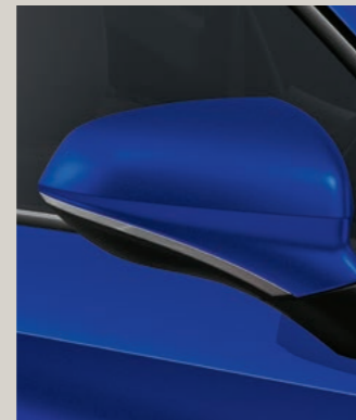
MYSTERY BLAU (METALLIC)