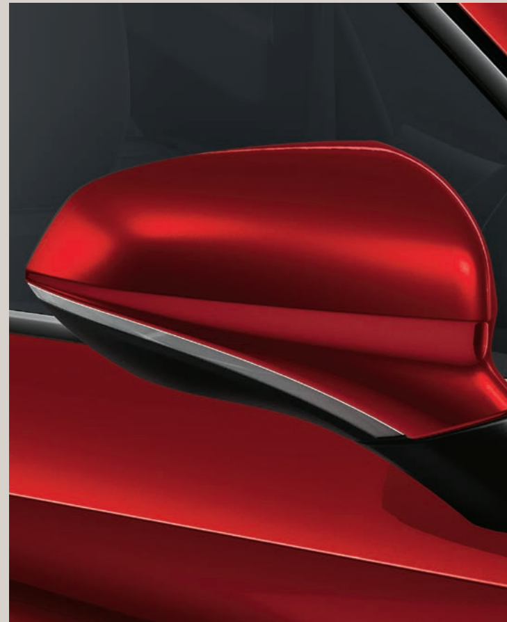
DESIRE ROT (INDIVIDUALLACKIERUNG)

* Urban Silber verfügbar ab KW 34/2020. ** Außenspiegel lackiert in Cosmos Grau bei Ausstattungsvariante FR.