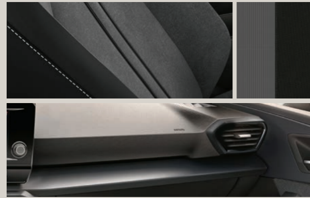
STOFF IN ANTHRAZIT