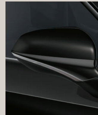
MIDNIGHT SCHWARZ (METALLIC)