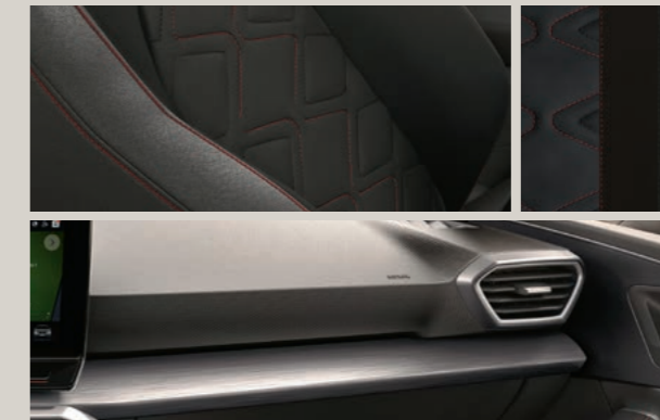
LEDER IN ANTHRAZIT MIT NAHTFÜHRUNG IN ROT 1